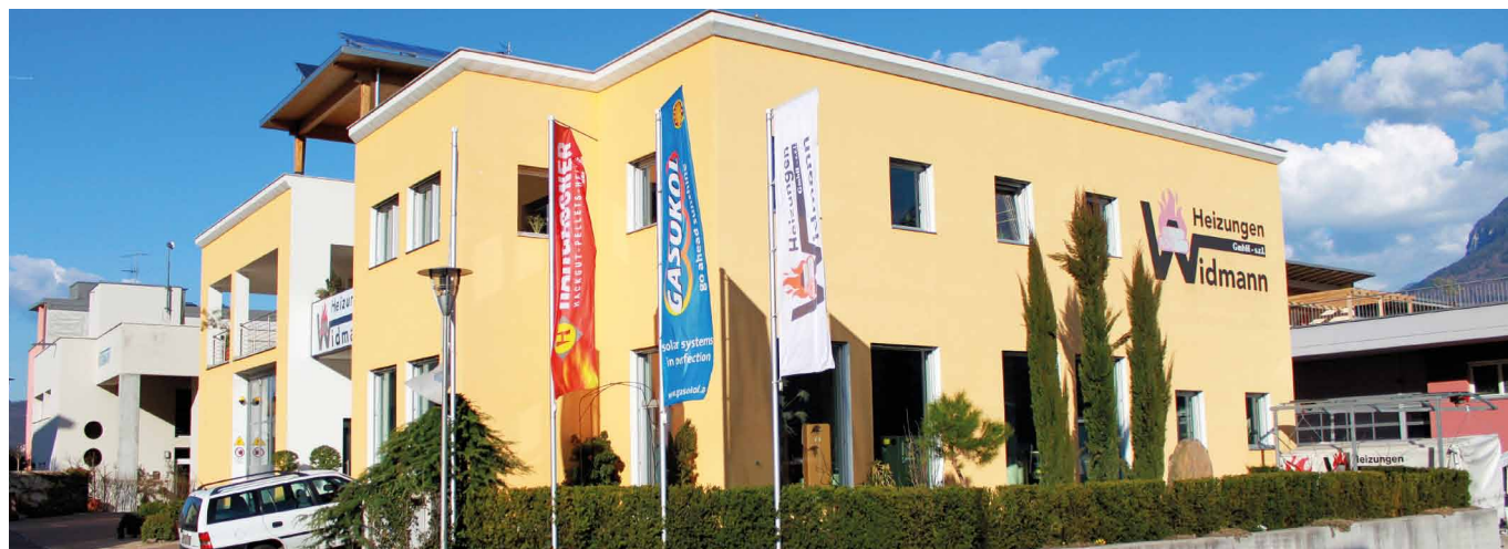
Der Firmensitz von Widmann Heizungen GmbH

Mehr über dieses umweltfreundliche Unternehmen finden Sie unter: www.widmann-heizungen.it .