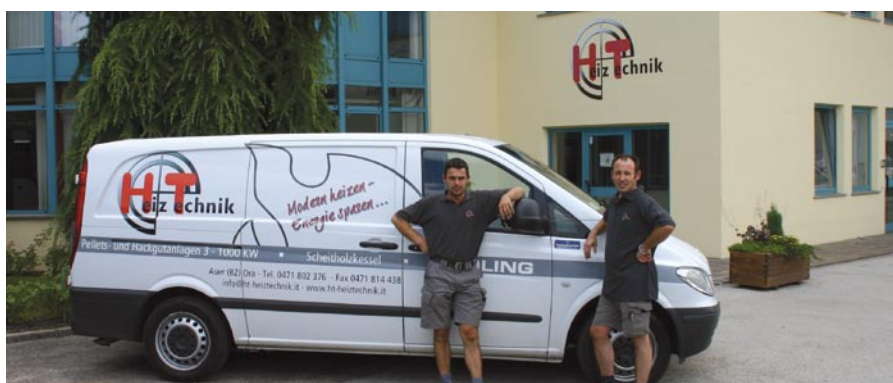
Das Firmengelände von HT Heiztechnik