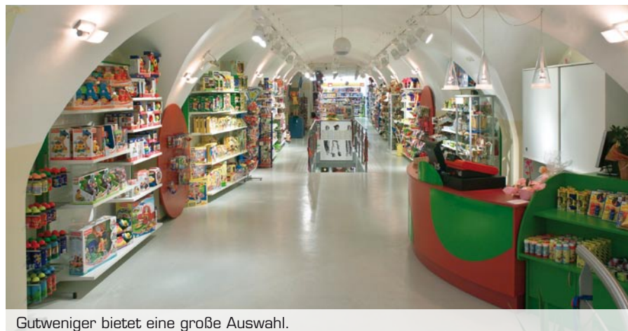
Gutweniger bietet eine große Auswahl.