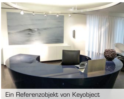
Ein Referenzobjekt von Keyobject