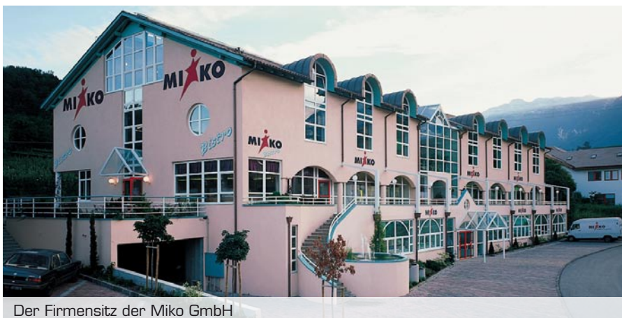
Der Firmensitz der Miko GmbH