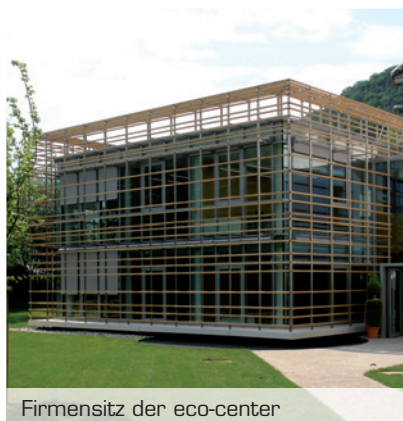
Firmensitz der eco-center

Neukunde des Monats ist die eco-center AG in Bozen. 1994 von der Gemeinde Bozen, der Autonomen Provinz Bozen sowie 53 Gemeinden gegründet, beschäftigt das Unternehmen heute über 114 Mitarbeiter. Die Hauptaufgabe von eco-center ist es, im Auftrag der Bürger Anlagen für die Abfallentsorgung und Abwasserreinigung zu betreiben. Angestrebt werden neben möglichst kostenkünstigen Dienstleistungen für den Bürger insbesondere eine andauernde Verbesserung der betrieblichen Abläufe und Verfahren sowie eine Verminderung der Umweltbelastung. Die eco-center AG verfolgt ihre Mission mit Nachdruck und misst der Gesundheit der Bevölkerung und dem Schutz der Umwelt oberste Priorität bei.